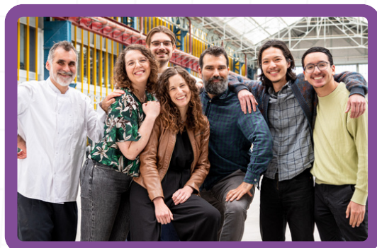
L'équipe A Table Citoyens

Accompagner des femmes éloignées de l'emploi vers l'obtention d'un CAP Cuisine, en leur permettant de se former aux côtés de chef.f.es de restaurants gastronomiques ou étoilés.